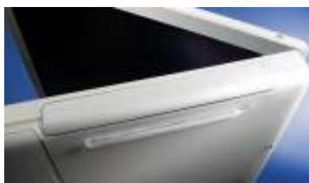
Мягкие амортизаторы индивидуальной формы Рис.104 3М™ Vimpro™ MB1102-102 предназначены для светлых или белых ноутбуков для защиты поверхности от царапин и защиты от скольжения.