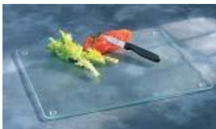
Прозрачные защитные амортизаторы

Ваша бытовая техника не поцарапает поверхность если вы выберете амортизаторы 3M™ Vumpro™ Products. 3M предлагает широкий спектр адгезивов и форм, которые помогут сэкономить вам время и силы. Так же мы предлагаем индивидуальный подход в выборе подходящей для вас формы, размера и цвета.