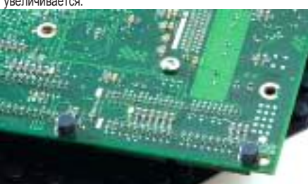
Амортизаторы для печатных плат

Для устранения шума и вибрации используйте амортизаторы серии 5400 белого цвета. Они превосходно подходят для шкафчиков и дверей, обладают шумопоглощающими свойствами, устойчивы к старению и растрескиванию.