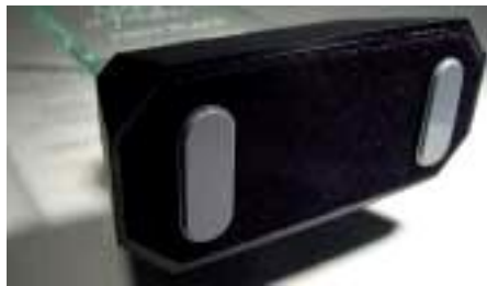
Амортизаторы индивидуальной формы Рис.103 Серия 3М™ Vimpro™ MB1102-113 предназначена для защиты от царапин предметов и поверхностей нестандартной формы.

Примечание: Представленная техническая информация может использоваться корректно только для типовых применений.