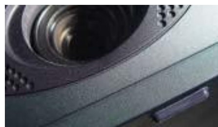
Нескользкие ножки индивидуальной формы Рис.105 3М™ Vimpro™ MB1104-105 идеальны в качестве нескользких ножек для видео проекторов.